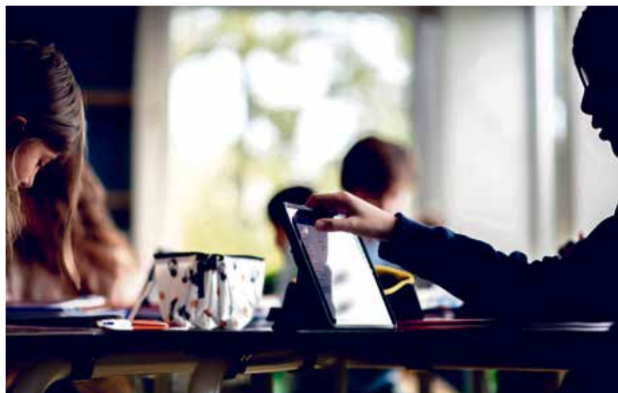
Chacun des 1500 élèves de l'école est équipé d'une tablette numérique.

FORMATION Accélérant la numérisation de la société, la pandémie a exacerbé le débat sur l'informatique. Troisième du Prix SVC Genève, cet établissement n'a cependant pas attendu le virus pour se lancer