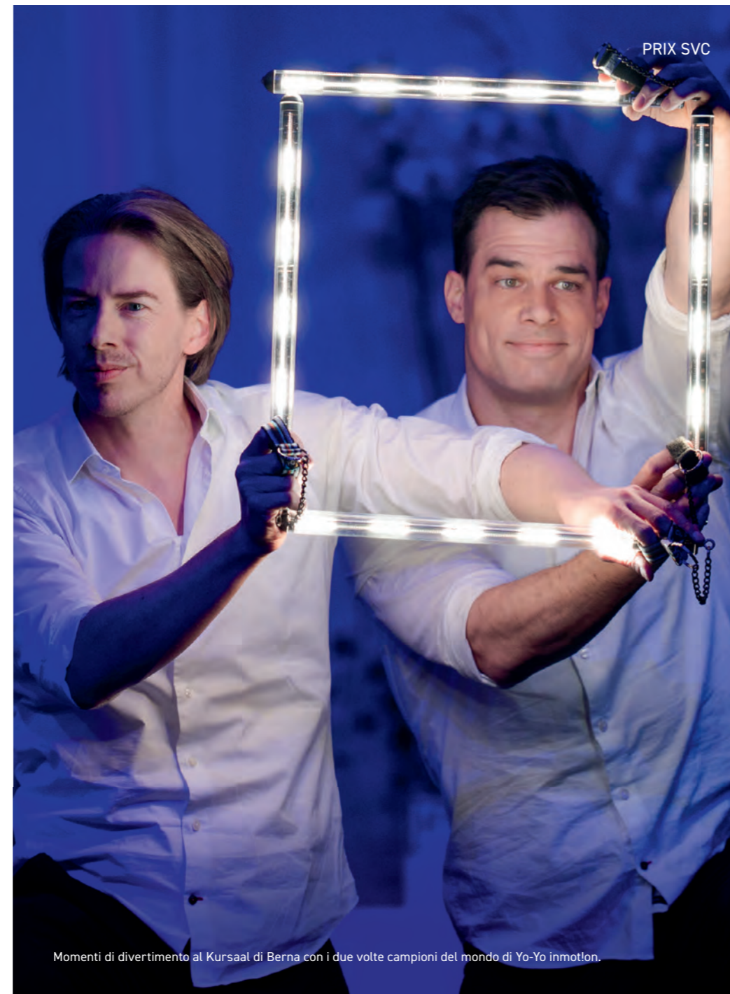
Momenti di divertimento al Kursaal di Berna con i due volte campioni del mondo di Yo-Yo inmotion.