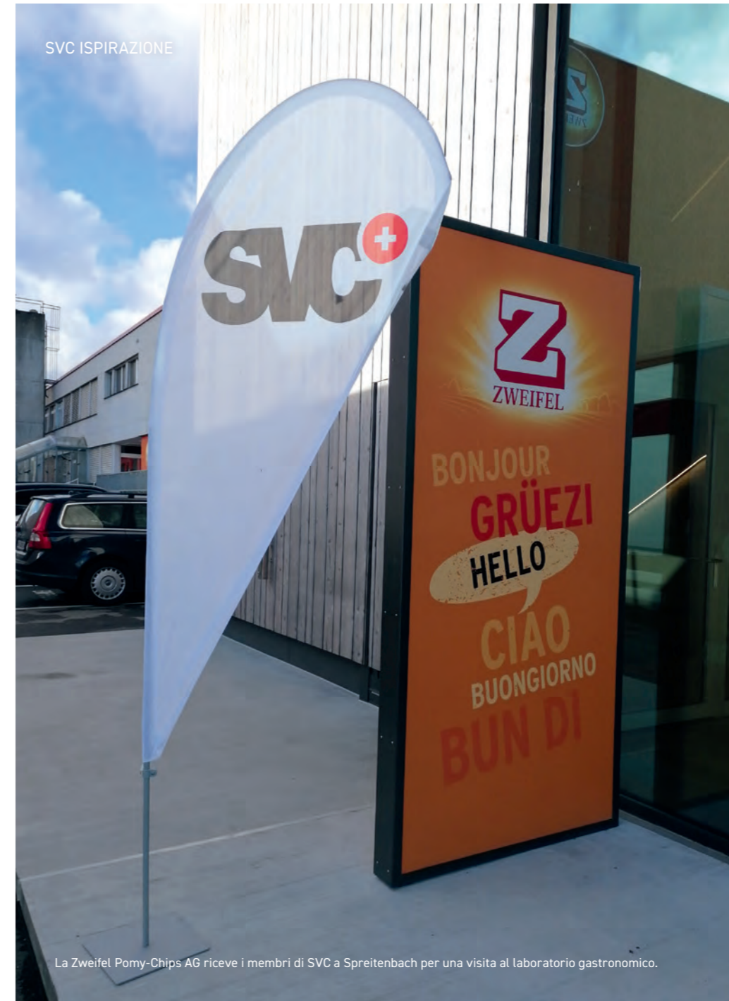
La Zweifel Pomy-Chips AG riceve i membri di SVC a Spreitenbach per una visita al laboratorio gastronomico.