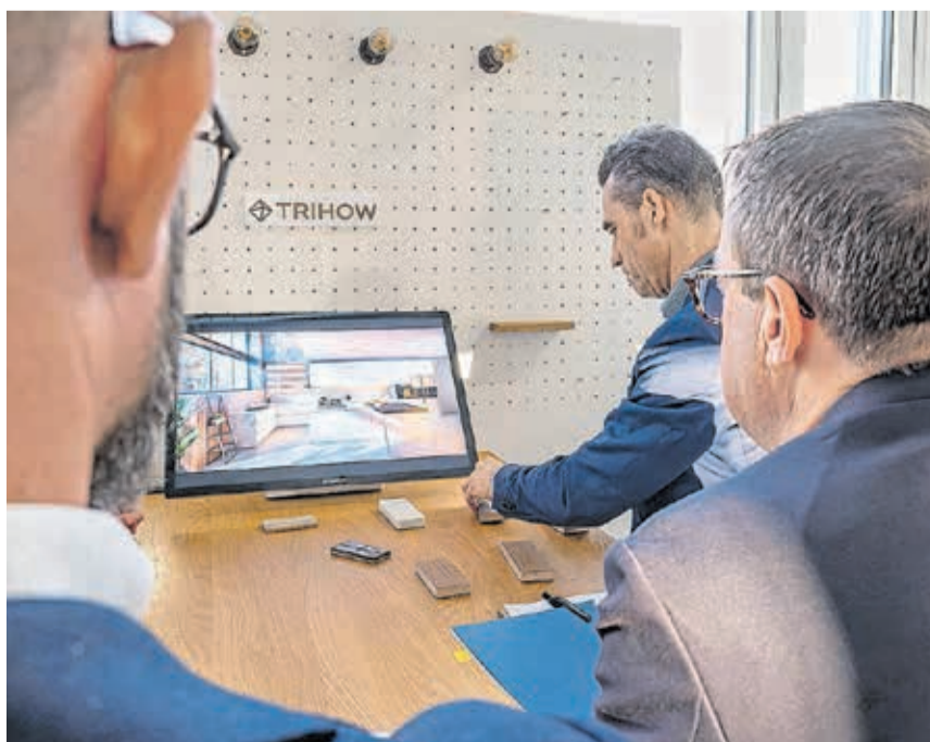
Die Jury durfte testen und staunte, wie hybrid heute funktioniert – dank der Trihow AG.

Die Firma Trihow in Rotkreuz beweist jedoch, dass sich die beiden Welten zusammenfügen lassen. Trihow