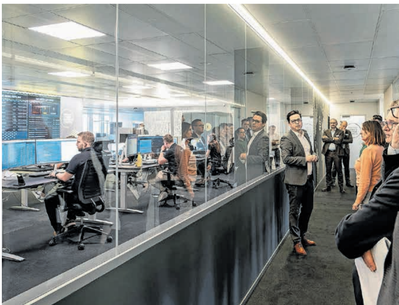
Die Jury beim Besuch bei InfoGuard.

Meldet die Kundschaft ein Problem, wird umgehend gehandelt. Binnen sechzig Minuten müssen die InfoGuard-Profis eine Lösung ausgeheckt haben. Und die Hacker stellen sie immer wieder vor knifflige Probleme: Sie wollen auf Bankkonten zugreifen. Sie wollen behördliche Daten knacken. Sie wollen einen Webshop lahmlegen.