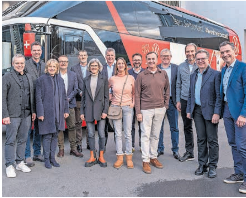
Die Jurymitglieder des diesjährigen Prix SVC Zentralschweiz.

Alle zwei Jahre zeichnet der Prix SVC Unternehmen aus, die durch her-