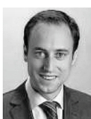
Christian Wasserfallen Nationalrat FDP